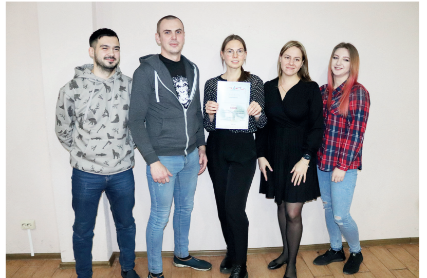
Победители интеллектуальной игры