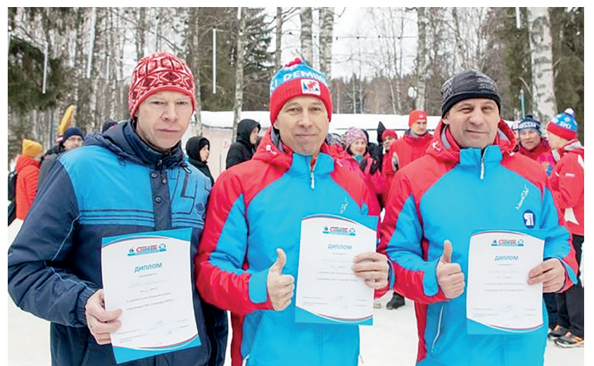
Фото: ЦОСВК, Сергей Иноземцев, участники соревнований

Следующий номер газеты выйдет 9 февраля 2023 года.