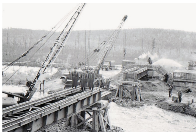
Так строили мосты и искусственные сооружения воины мостового батальона

На второй день пребывания в Тынде я представился начальнику отдела кадров войсковой части 46120 – это соединение железнодорожных войск Министерства обороны. Мне было предложено место службы в трех соединениях на выбор.