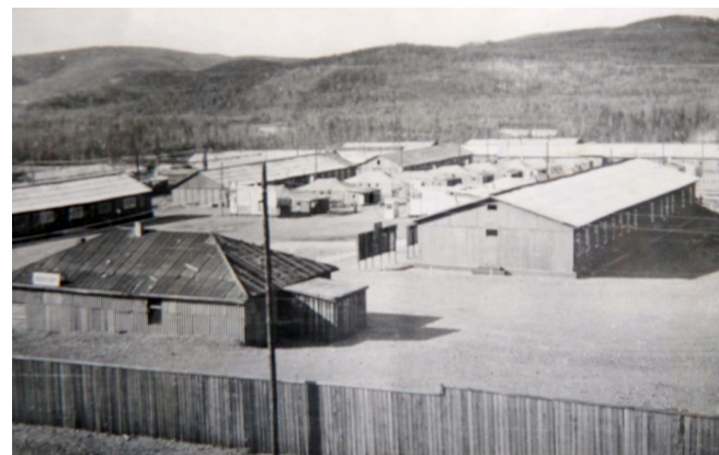
Вот так выглядели военные городки в постоянных местах дислокации, а на местах непосредственных работ военнослужащие размещались в утепленных палатках (стены из бревен, а вместо крыши – палатка)