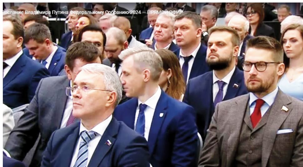
Послание Владимира Путина Федеральному Собранию 2024 — ПРЯМОЙ ЭФИР

Масштабный блок выступления президента касался социального пакета, кадровой и молодежной политики, образования. Владимир Путин заявил о запуске нового нацпроекта «Семья» и анонсировал целый ряд мер по поддержке семей с детьми. В частности, глава государства предложил продлить программу семейной ипотеки и программу маткапитала до 2030 года. Также в числе мер поддержки предусмотрено увеличение до 2 800 руб. в месяц налогового вычета на второго ребенка и до 6 тысяч руб. — на третьего и каждого