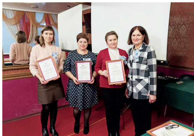
Победители конкурса «Лучшая цеховая профсоюзная организация»

Среди победителей – профсоюзные организации с высоким показателем профсоюзного членства.