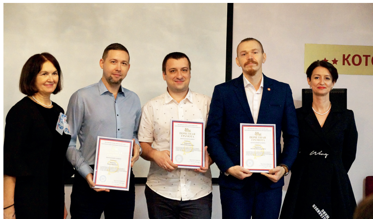
Награждение молодежного актива

Подходит к концу 2021 год. Для членов профсоюза, работников радиоэлектронной промышленности – это юбилейный год, 30 лет со дня создания Профсоюза. В областной организации Профрадиоэлектроника прошли мероприятия, посвященные этой дате. В каждой первичной профсоюзной организации были организованы торжественные мероприятия для поздравления членов Профсоюза.